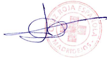
Fdo.: D. Jesús Carreño Dueñas

ASAMBLEA LOCAL DE CRUZ ROJA DE MADRIDEJOS