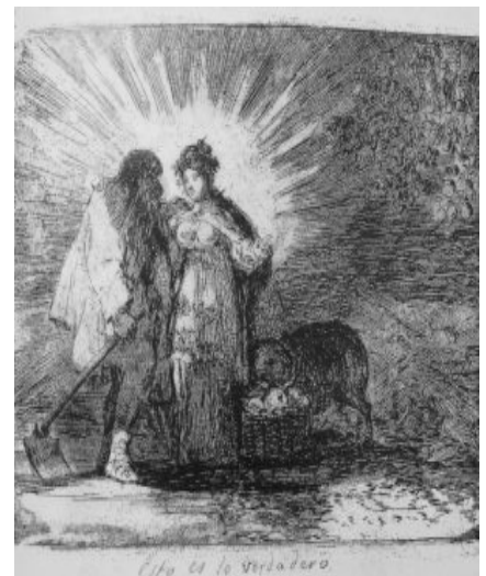
Los Desastres de la Guerra. Grabado Francisco de Goya.

La que nos interesa por su relación con la Constitución, es la última de la serie, la número 82, donde a modo de conclusión da una esperanza respecto a los anteriores, con un contenido más pesimista. Representa la abundancia y la felicidad, un manifiesto a favor de la paz y el trabajo, principios ilustrados, base de las ideas de los liberales del siglo XIX. El gesto de la mujer radiante, de su mano izquierda, nos da la pista de que es una alegoría de la Constitución, como la que está dibujada en la portada de la primera edición de la Constitución de 1812.