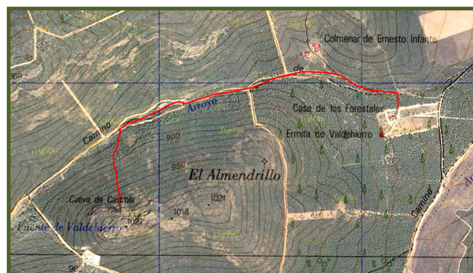
Ruta del Bandolero "Castrola"

Muy cerca del Aula de Naturaleza, a cinco minutos caminando, tenemos un área recreativa con barbacoas y mesas por si los participantes en la actividad se quieren quedar a comer en las Sierras.