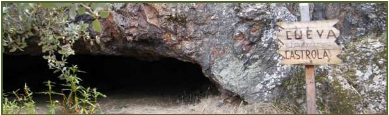
Acceso a la Cueva "Castrola"

El paseo tiene una duración de 3,5 horas (ida y vuelta incluyendo paradas y actividades), es de dificultad media .