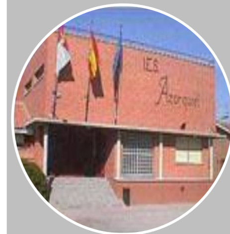
Institutos de Enseñanza Secundaria (IES)