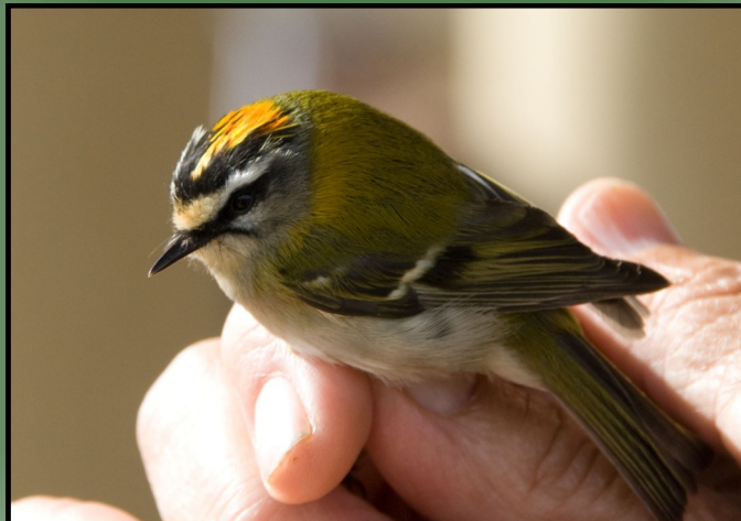
Reyezulo listado ( Regulus ignicapilla ) anillado en el Curso de Iniciación a la Ornitología realizado en el Aula de Naturaleza "Valdehierro" , el 24 y 25 de octubre de 2015).