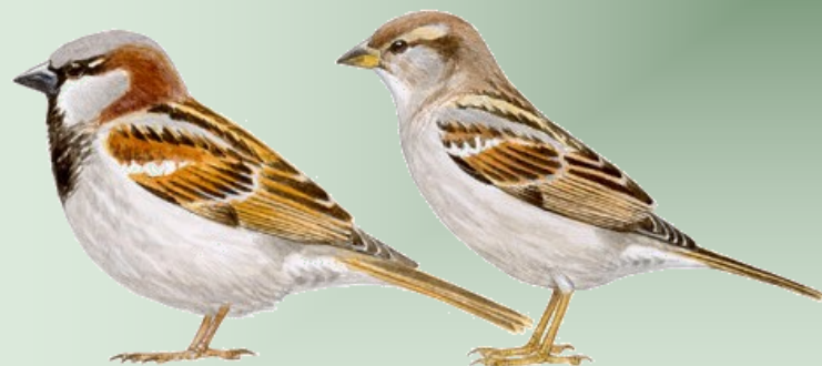
Pareja de gorriones comunes, ( Passer Domesticus ) Dibujo de Juan Varela