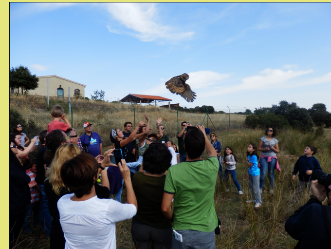
Liberación de Búho Real procedente del CERI (curso de Iniciación a la Ornitología realizado en el Aula de Naturaleza "Valdehiero", el 4 y 5 de octubre de 2014).

Entrega de diplomas y clausura del curso.